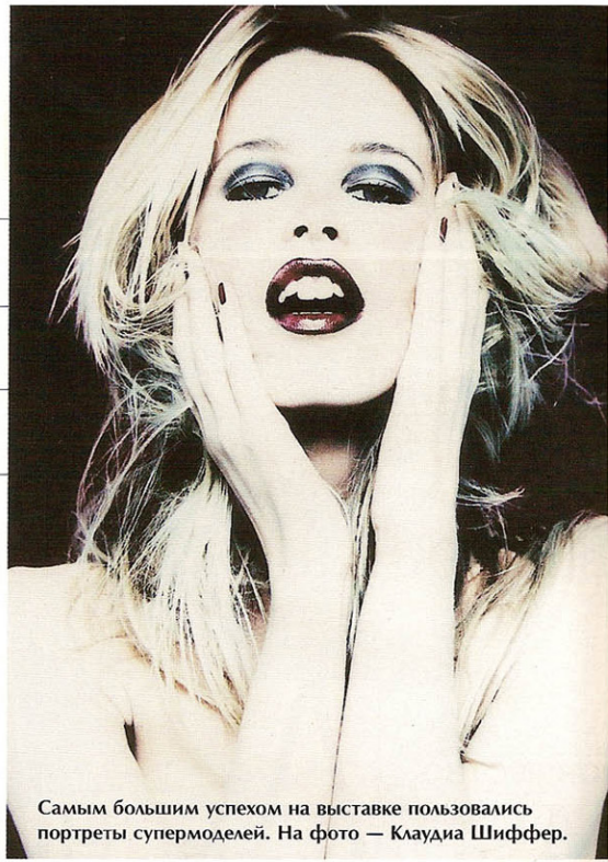
Самым большим успехом на выставке пользовались портреты супермоделей. На фото – Клаудиа Шиффер.