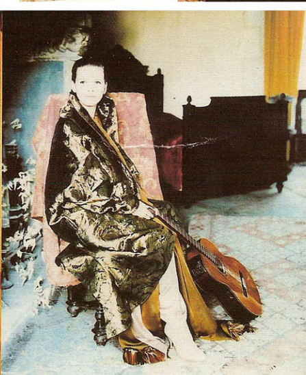
Слева направо: Изабелла Росселлини – «из Африки», Дженнифер Лопес в привычном амплуа «латинской любовницы»; Жюльетт Бинош – «Три цвета – синий».