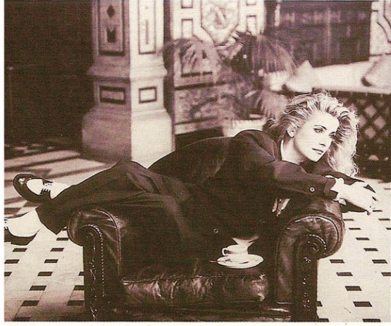
Слева: фото Катрин Денев для рекламной кампании Yves Saint Laurent; справа: Ив Сен-Лоран.